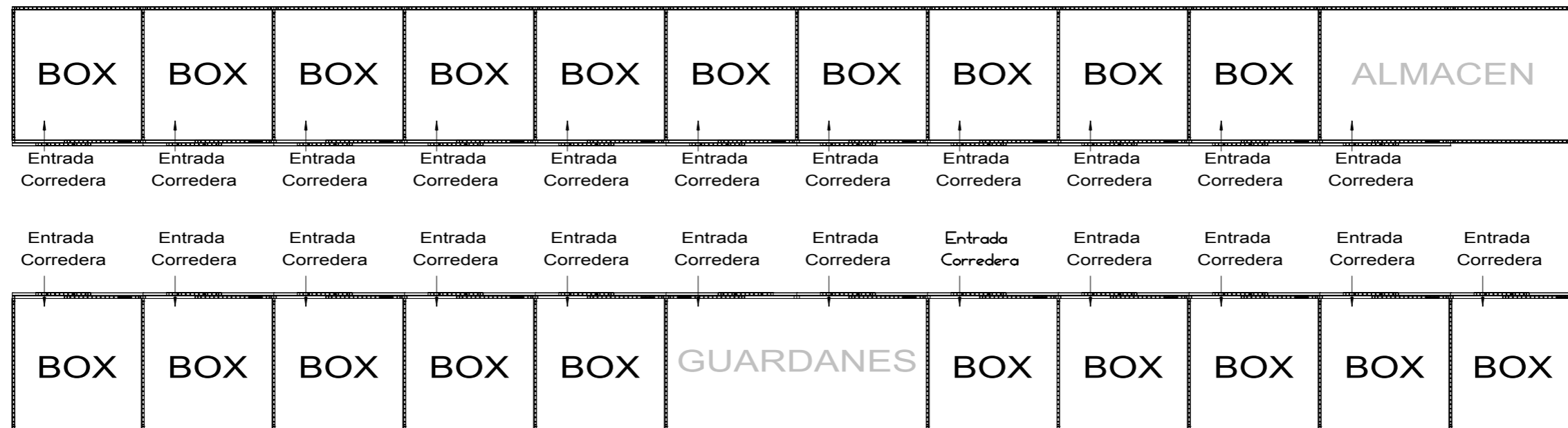
PLANTA DE DISTRIBUCIÓN